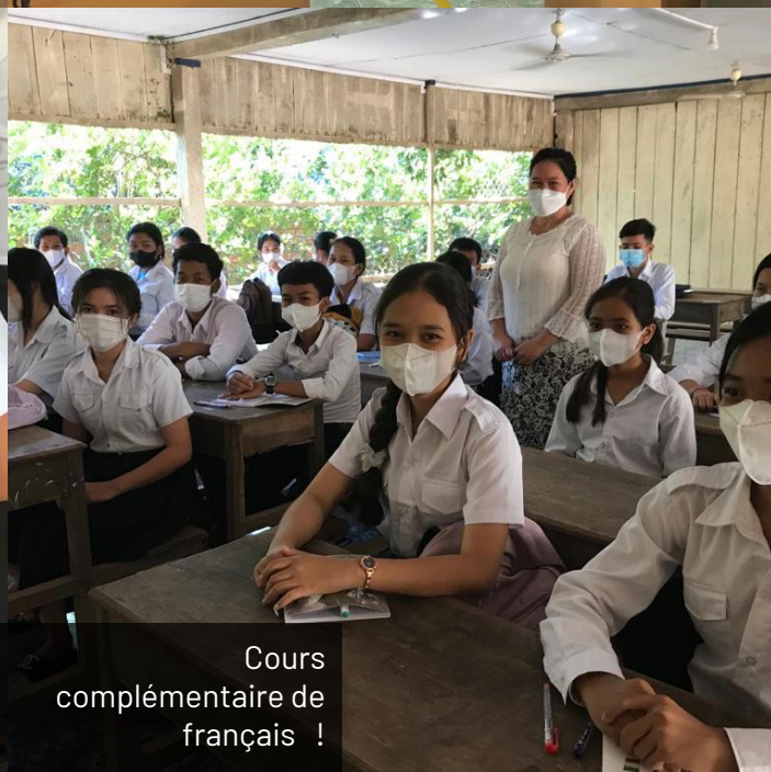
Cours complémentaire de français !