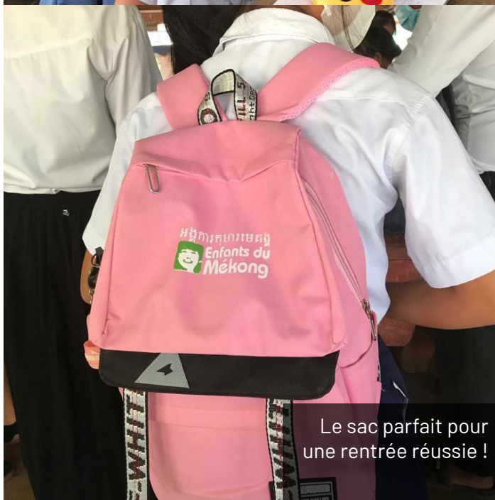
Le sac parfait pour une rentrée réussie !